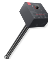
Heizstab SMARTFOX Pro Heater