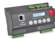
Energiemanager SMARTFOX Pro 2