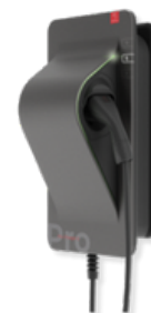
Wallbox SMARTFOX Pro Charger