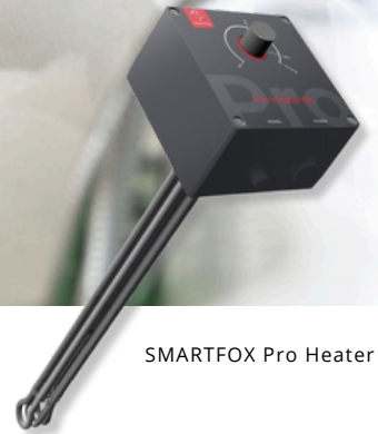
SMARTFOX Pro Heater